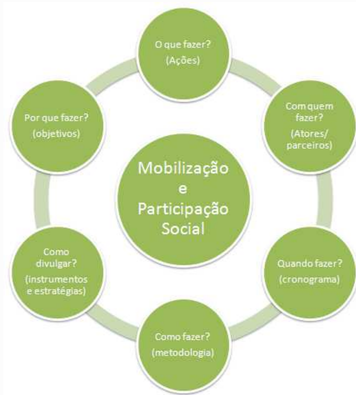
Figura 3. Metodologia da mobilização e participação social

Algumas das atividades a serem desenvolvidas pelo grupo são: