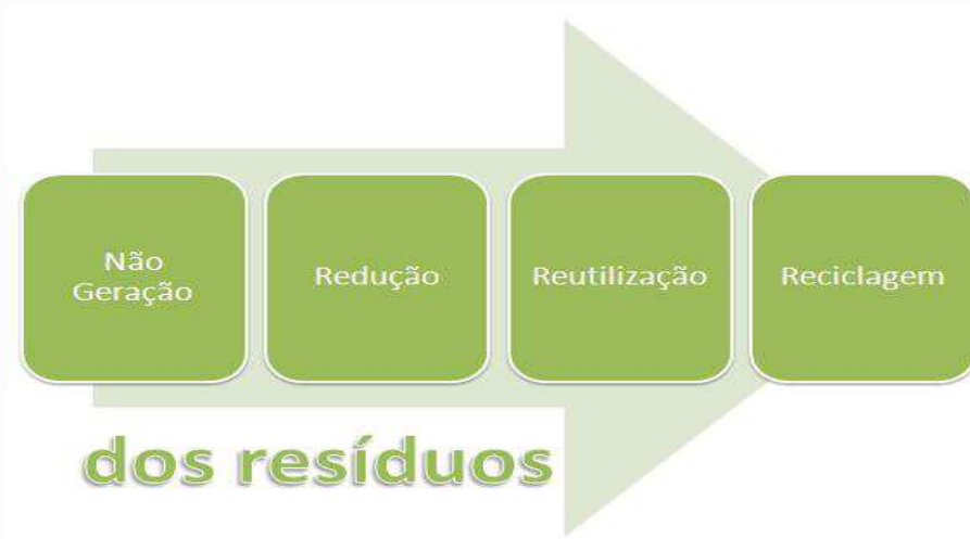
Figura 1. Prioridade dos programas e ações de educação ambiental