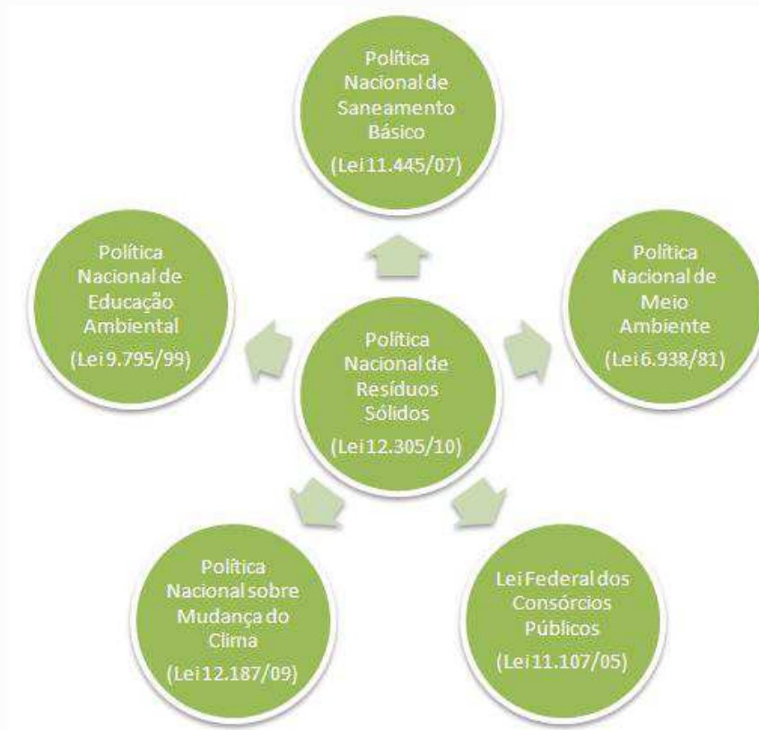
Figura 2. Integração da Política Nacional de Resíduos Sólidos com legislações correlatas

Da mesma maneira está inter-relacionada com as políticas urbana, industrial, tecnológica e de comércio exterior, bem como com as que promovem a inclusão social.